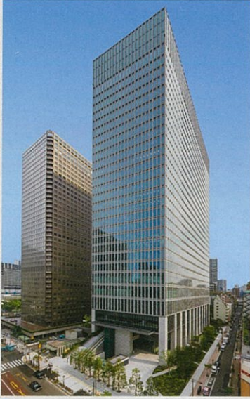
■ ニッセイ浜松町クレアタワー新築工事（東京都）