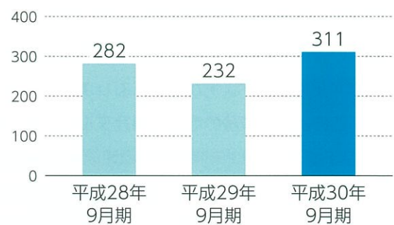
売上高 (単位 億円)