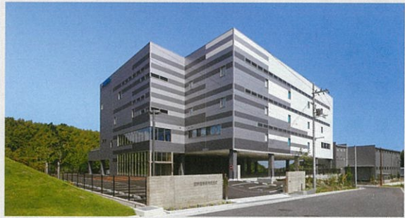
■ 宮野医療器株式会社岸和田物流拠点新築工事（大阪府）