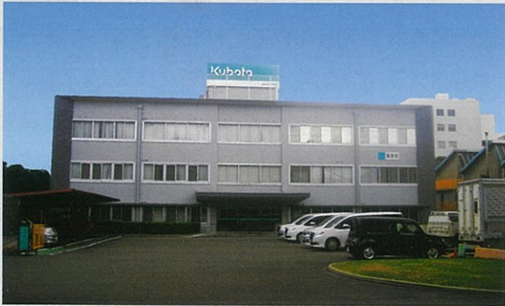
■ 堺製造所耐震改修工事（表事務所、厚生棟、F-4棟）（大阪府）