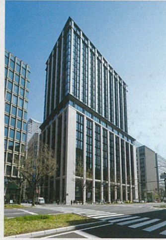
■ 株式会社三菱UFJ銀行大阪ビル新築工事（大阪府）