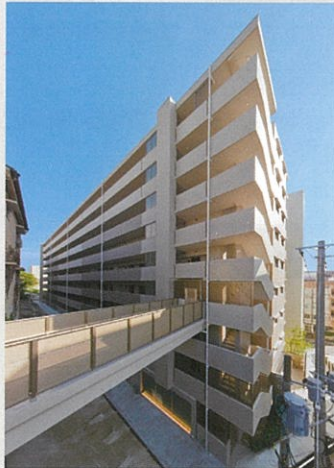
■ アルファステイツ佐世保駅北Ⅱ新築工事（長崎県）