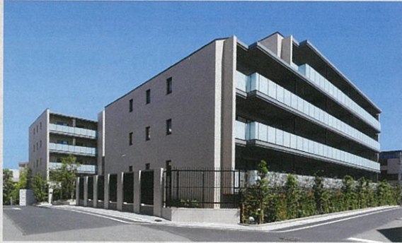
■ オーベル鷺沼プロジェクト新築工事（神奈川県）