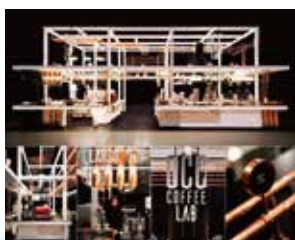
金賞 SCAJ 2017 UCC上島珈琲ブース

一般社団法人日本空間デザイン協会が主催する世界最大規模の空間環境系のデザイン賞「日本空間デザイン賞2018」にて、当社担当案件が多数受賞。応募総数771作品の中から、金賞2作品、銀賞1作品、BEST50賞1作品、入選14作品と、合わせて18作品が選出されました。