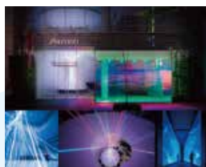
金賞 EXPERIENCE A NEW ENERGY 資生堂銀座ビル