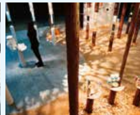
日本製紙株式会社 エコプロダクツ2015