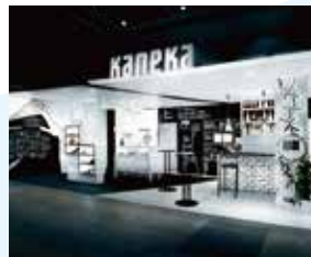
株式会社カナカ ライティングフェア2015