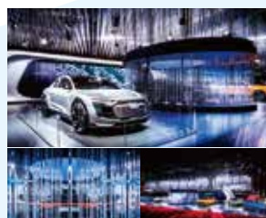
銀賞 Tokyo Motor Show 2017 Audiブース