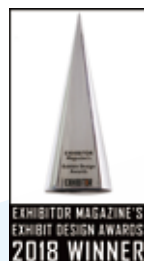
EXHIBITOR MAGAZINE'S EXHIBIT DESIGN AWARDS 2018 WINNER

アメリカのエキシビションデザイン情報誌「EXHIBITOR Magazine」が主催する展示デザインアワード「EXHIBITOR Magazine's 32nd Annual Exhibit Design Awards」において、Gold2作品、Silver1作品の合わせて3作品を一企業として最多受賞いたしました。