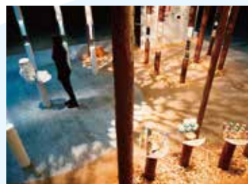
株式会社デンソー 第7回教育ITソリューションEXPO