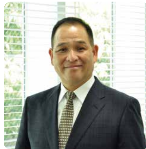
株式会社博展 代表取締役社長