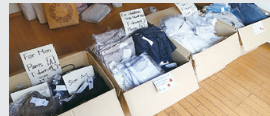
佐賀県「SAGA Ukeire Network」への提供衣料品