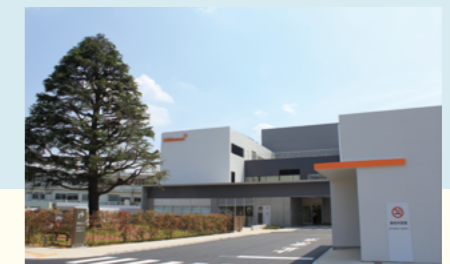
キッコーマン総合病院

当社グループの創業の地である千葉県野田市で、総合病院を運営し、訪問看護なども行っています。日本で唯一の食品メーカーが設立した総合病院として、「日本一おいしい病院食への挑戦」を掲げています。