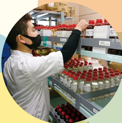
加工用サンプル作製