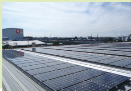
キッコーマンフードテック株式会社

CO 2 排出量を削減するために、太陽光パネルの設置などに加え、再生可能エネルギー電力の導入を推進しています。