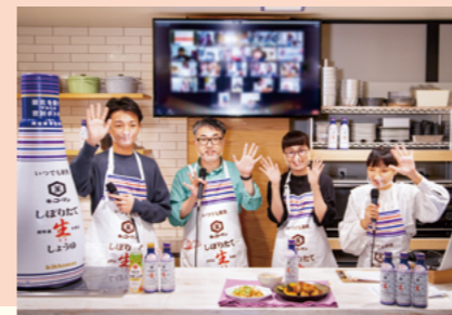
ホームクッキングmeeting おいしい記憶をつくろう! 親子クッキング