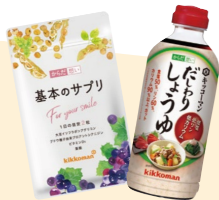
基本のサプリ だしわりしょうゆ

当社は、キッコーマングループの技術や研究開発の知見を駆使し、お客様の健康をサポートするこだわりの商品を開発・販売しています。からだの変化を上手に乗り越えるための「からだ思いサプリメント」、低塩・低リン・低カリウムに配慮した「だしわりシリーズ」、トイレの悩みに着目した「クランベリーURシリーズ」などをご提供しています。