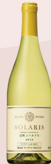
ソラリス 信州 シャルドネ 2018

当社は、山梨県勝沼と長野県小諸にワイナリーを所有し、日本ワインを中心に世界に通用するワイン造りをめざしています。オンラインショップでは、国賓級VIPの迎賓にもたびたび使用されている「ソラリス」シリーズや、造り手のこだわりが詰まったワイナリー限定商品など、高品質な日本ワインを多数取りそろえていますので、ぜひお楽しみください。