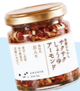
サクサクしょうゆ アーモンド