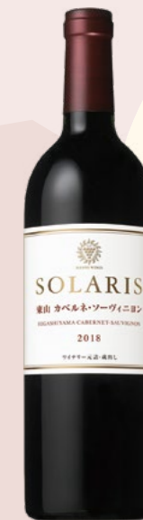
ソラリス 東山 カベルネ・ソーヴィニヨン 2018