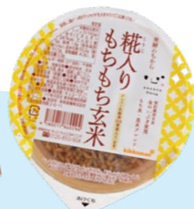
糀入りもちもち玄米