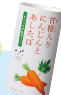
甘糀入りにんじんと あしたば