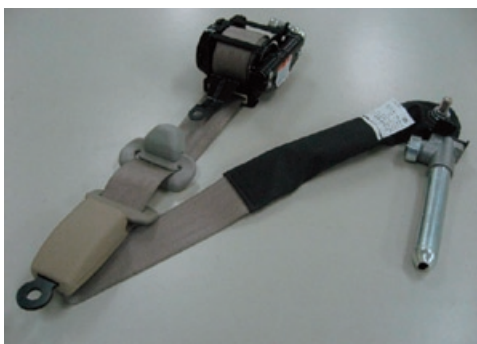
▲自動車用シートベルト

シートベルトは、メキシコ現地法人での生産が開始するなど、増収要因がありましたが、受注車種の減産の影響を受け、売上が減少したほか、エアバッグにつきましても伸び悩みました。内装品その他につきましては、海外も含め順調に推移いたしました。