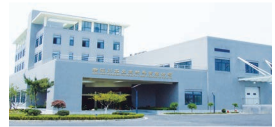
浙江川本衛生材料有限公司

持分譲渡を機に両社の関係を更に深め、当社大阪工場と浙江川本のガーゼ製品の製造工程を全体最適の観点から見直し、競争力の強化を図ってまいります。また、中国で今後の需要拡大が見込まれる付加価値の高い医療衛生材料（手術関連製品など）を中国国内にも拡販し、当社の海外事業展開のスピードアップを実現してまいります。