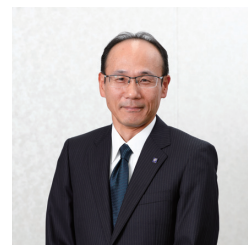
代表取締役社長執行役員

株主の皆様におかれましては、今後とも変わらぬご理解とご支援を賜りますよう、心よりお願い申し上げます。