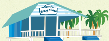
IDビーチハウス 「Henry Africa」