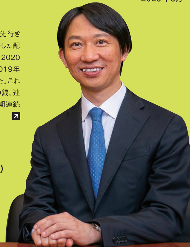
代表取締役社長兼 最高執行責任者(COO)