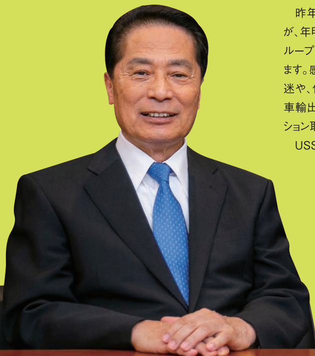
代表取締役会長兼 最高経営責任者(CEO)