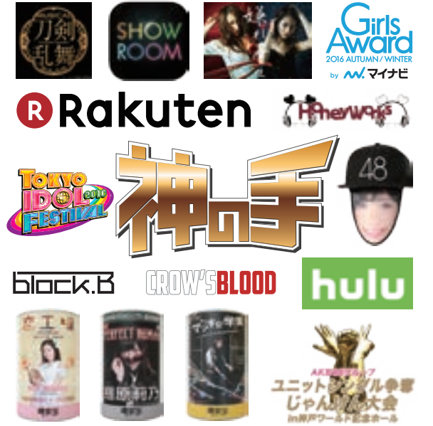
© Brangista Game, Inc. © AKS © ミュージカル「刀剣乱舞」製作委員会 © 2016 TOKYO IDOL PROJECT

神体験3Dクレーンゲーム「神の手」は、2016年(平成28年)6月のスタート以来、多くのコアファンが存在するコンテンツ・メディア・企業とのコラボ景品を次々と生み出しています。舞台「マジすか学園」との景品となった場空缶は、リリースから2時間で完売。フジテレビとのコラボ企画、世界最大のアイドルイベント「東京アイドルフェスティバル」では70組以上の神の手限定のアイドル景品を企画。また楽天グループとは、長期的な無料抽選台の展開を行い、楽天の各サービスで人気の企画景品を投入してまいります。今後もファンが欲しくなる魅力的な神景品を続々と企画してまいります。