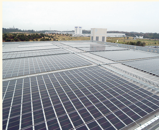
日に新たな館屋上の太陽光発電システム

また、「健康経営優良法人2018(ホワイト500)」に2年連続で選ばれています。