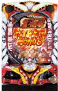
「ぱちんこCR北斗の拳7 転生」 ©武論尊・原哲夫/NSP 1983, ©NSP 2007 著作権許諾証YKO-116 ©Sammy

2017年4月に発売した『ぱちんこCR北斗の拳7 転生』は、サミー(株)が誇る人気シリーズ「北斗の拳」の最新作です。革新的なバトルモード「BATTLE RUSH」のもと、史上最強のバトルスペックを実装。従来の概念を超えた可動ギミックと紡がれてきた演出の大なる融合により、シリーズ最高の完成度を誇る自信作に仕上げました。