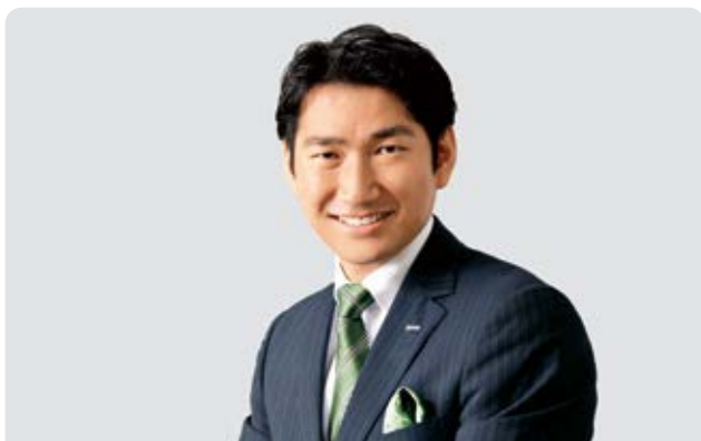
セガサミーホールディングス株式会社 代表取締役社長 COO