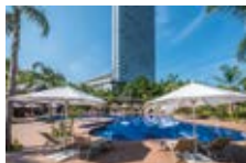
「THE LIVING GARDEN」

「シェラトン・グランデ・オーシャンリゾート」に隣接するガーデンエリアが、“大人を愉しむ水辺のリビング”をテーマに「THE LIVING GARDEN」としてリニューアルオープンしました。ガーデンプールの周辺に居心地の良いソファ席や、貸切りタイプの「ガゼボ」を配置。黒松に囲まれたエリアには、焚火を囲んでゆったり寛げる「焚火のリビング」や、ガーデンエリアを一望するガラス張りのバー「KUROBAR」など、特別なリゾート時間をお過ごしいただける空間が誕生しました。