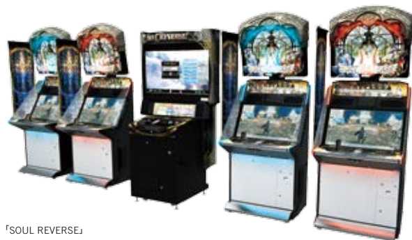
「SOUL REVERSE」 ©SEGA

今冬、セガが贈る超大作ファンタジー「ソウルリバース」シリーズに、アーケード版『SOUL REVERSE』が登場。最大10人vs10人のネットワーク対戦アクションゲームで、爽快かつ迫力のバトルが味わえます。アーケードゲーム史上最高のクオリティで緻密に描き出されたファンタジーの世界観は、幅広いプレイヤーを虜にします。