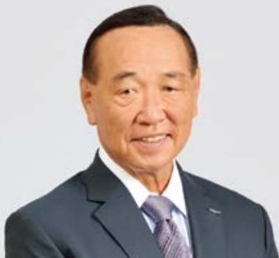
セガサミーホールディングス株式会社 代表取締役会長CEO