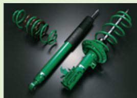
写真はHONDA フィット用SP KIT

全長調整式車高調整機構、単筒式構造(ストラットタイプはストロングチューブ正立式構造)、また16段階の伸/縮同時減衰力調整機構+ADVANCEニードルによるEDFCシリーズへの対応を始め、より繊細なセッティングを可能とするキャンバー・キャスター調整式ピロボールアッパーマウントやキャンバー調整機能付ロアブラケットを搭載するとともに、新たにスプリングレートの変更やダンピングフォースをカスタマイズするシステムも採用。コアなユーザーの高い要求に応え、サーキットでは1/100秒を追求するワンランク上の高次元なサスペンションチューニングを可能としたプレミアムモデル。