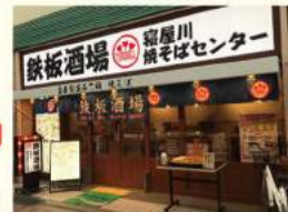
寝屋川焼そばセンター