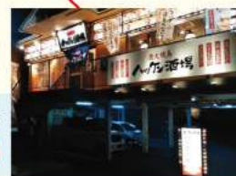
ハッケン酒場 本陣店