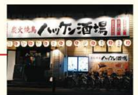
ハッケン酒場 与野店