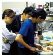
マルシェマイスター制度

次に、店舗スタッフのモチベーション向上と学ぶ機会を提供するべく、看板メニューの知識取得と調理技術の向上を目的とした当社独自の認定制度である「マイスター制度」を導入いたしました。八剣伝の焼き技術、居心伝や焼そばセンターの鉄板技術、酔虎伝の名物料理技術等の検定試験を行い、合格者のスタッフには、マルシェマイスターの称号を付与いたします。今期4月より、関西地区の各業態でスタートし、下期には全国各地区へも広げてまいります。