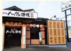
ハッケン酒場 原田店