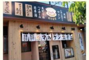
餃子食堂マルケン 仙台泉中央店