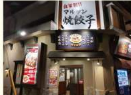
餃子食堂マルケン 市岡店