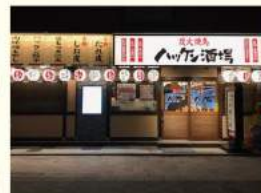
ハッケン酒場 舟入平和大通り店