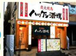
ハッケン酒場 関大前店