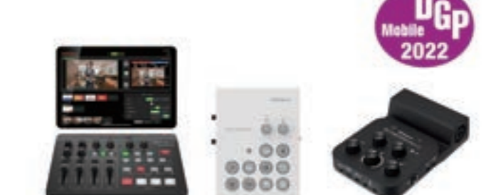
「DGPモバイルアワード2022」を受賞した『AeroCaster』(左)、『GO:LIVECAST』(中央)、『GO:MIXER PRO-X』(右)

GO:LIVECAST : スマートフォンを使ったライブ配信で、テロップの文字や拍手などの効果音を簡単に加えることができ、一人での配信作業でもテレビ番組のように本格的な演出を可能にするツールです。