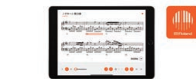
『Roland Piano App』

スマートフォンやタブレットとローランドのピアノをBluetooth®で接続して、ピアノをより楽しめる無料アプリ『Roland Piano App』を、2022年8月より提供開始。多彩なジャンルの内蔵曲の譜面を表示したり、音あてゲームで基礎力を身に付けたり、日々の練習をサポートする機能が満載です。1週間程度で1曲学べるプログラムもあり、初心者の方でも独学でピアノに取り組みます。『Roland Cloud』の有料メンバーシップに加入すると、300以上の楽曲/譜面が入手でき、楽しみがさらに広がります。