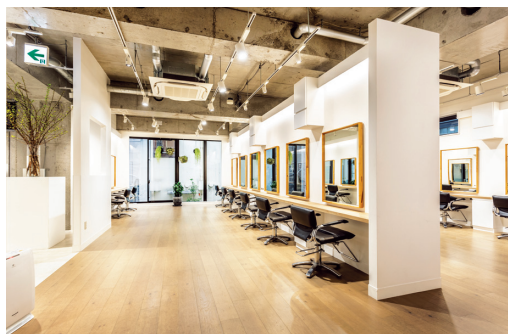
モッズ・ヘア 青山プリヴィレージュ店

代表写真：Hair & Make up 恩田嘉寿美(青山プリヴィレージュ店スタイリスト)