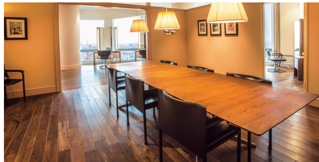
モッズ・ヘア オン アンダーズ東京

東京都渋谷区千駄ヶ谷一丁目11番1号MHビル TEL. 03-5411-7222 FAX. 03-5411-7223 URL. http://mhgroup.co.jp/