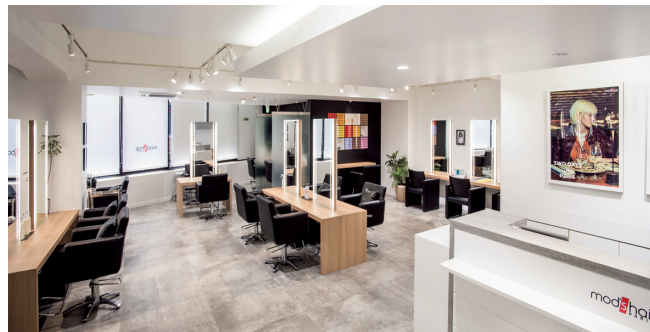
モッズ・ヘア新宿サウス店

東京都渋谷区千駄ヶ谷一丁目11番1号MHビル TEL. 03-5411-7222 FAX. 03-5411-7223 URL. http://mhgroup.co.jp/