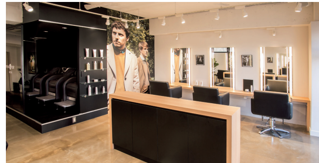
モッズ・ヘアMEN中野店

東京都渋谷区千駄ヶ谷一丁目11番1号MHビル TEL. 03-5411-7222 FAX. 03-5411-7223 URL. http://mhgroup.co.jp/