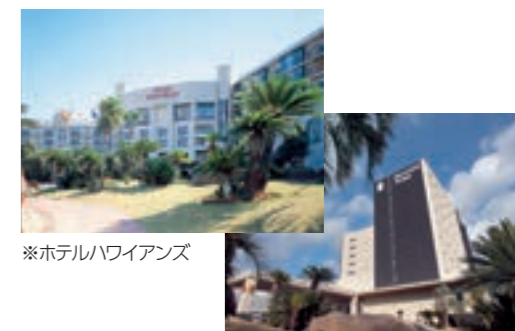
※ホテルハワイアンズ

いずれも初めての受賞で、ゴールドアワードは全国で80の施設が選ばれ、福島県内では唯一、東北エリアでは3施設のみが該当する中で選ばれました。