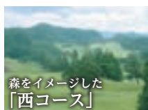
森をイメージした 「西コース」