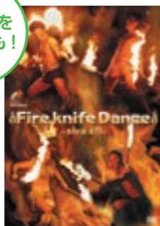
ハワイアンズファイヤーナイフダンスDVD siva ahi 5,184円(税込)