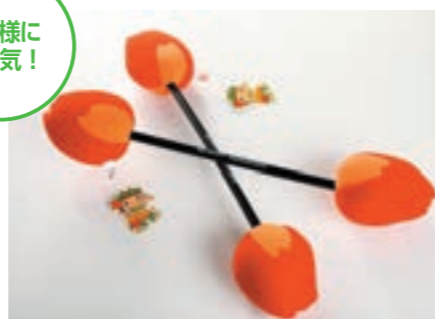
ファイヤー棒 890円(税込)