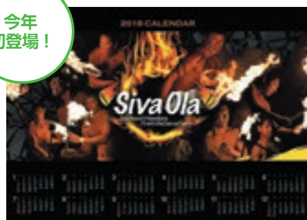
2018年 Siva Ola カレンダー 800円(税込)