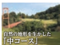
自然の地形を生かした 「中コース」