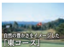
自然の豊かさをイメージした 「東コース」