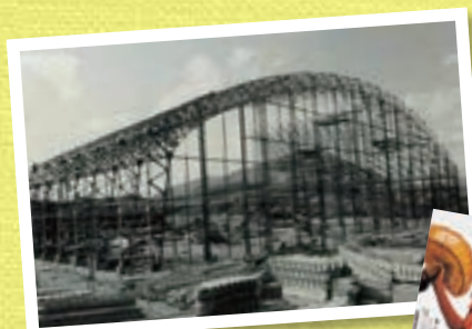
上)常磐ハワイアンセンター 建設工事 右)開業時のポスター