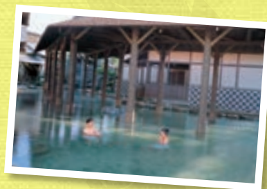
露天風呂「江戸情話 与市」