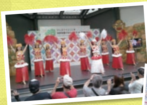
フラガール全国きずなキャラバン