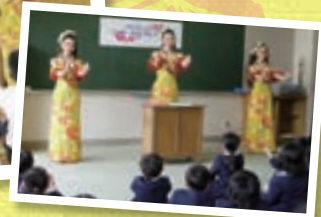
江名小学校(福島県いわき市)