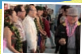
部分再開時の様子