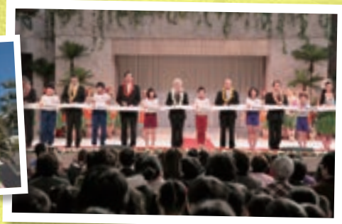
グランドオープンの様子