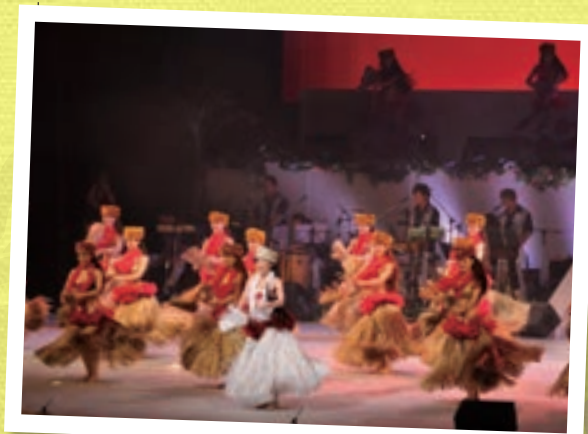
創立50周年記念 東京公演の様子