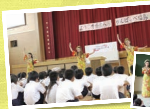
南小学校(奈良県田原本町)